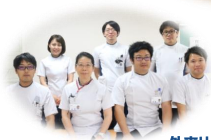
外来リハビリ部門スタッフ